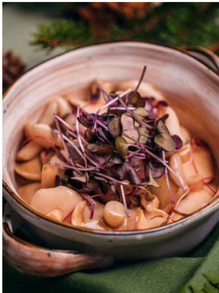
МАСЛЯТА КАРЕЛЬСКИЕ МАРИНОВАННЫЕ