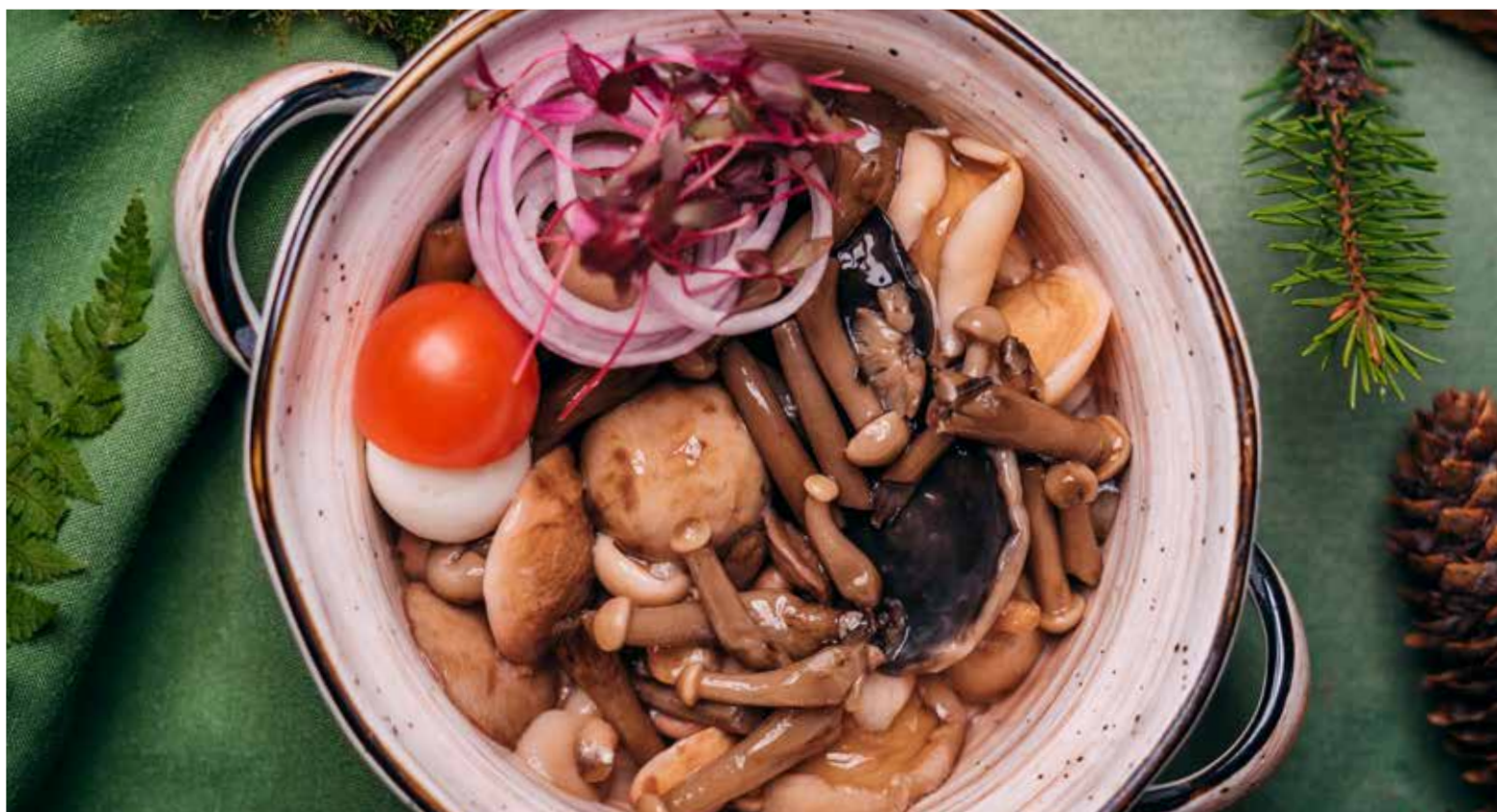
ГРИБНОЕ АССОРТИ «ЗАПАСЫ РУССКОЙ КЛАДОВОЙ»

Грибы лесные маринованные по деревенскому рецепту, подаются с репчатым луком приправленные ароматным маслом.