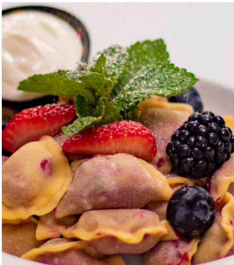
ВАРЕНИКИ С ВИШНЕЙ 200/40/50 г | 600 Р Вареники с начинкой из спелой, сладкой вишни. Домашняя сметана, ягодный соус.