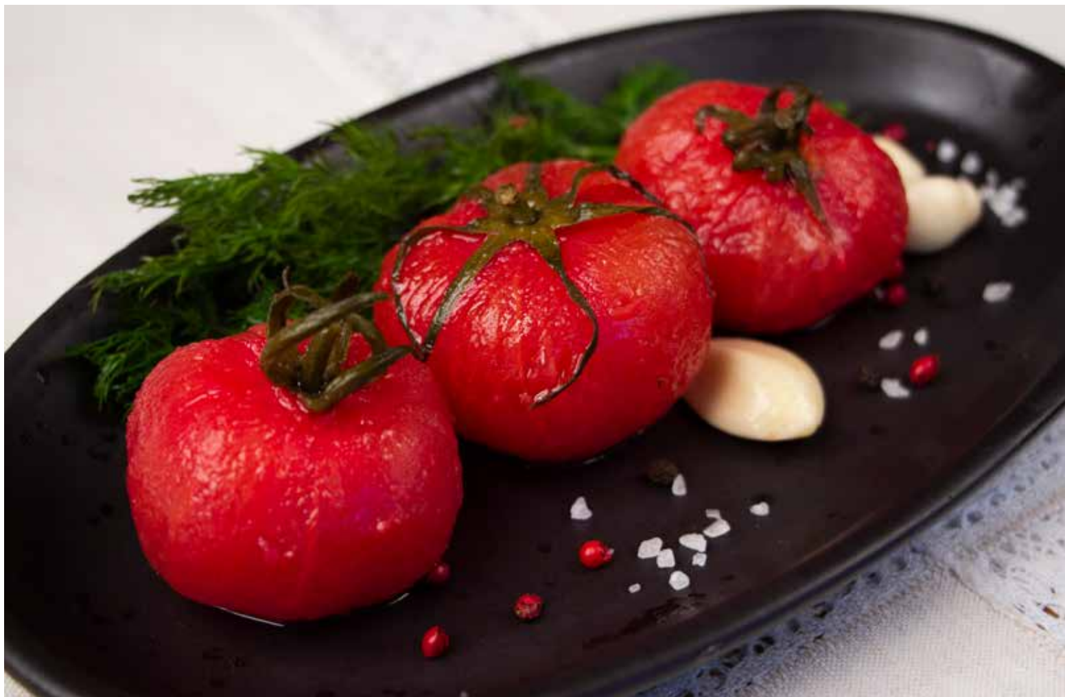
ПОМИДОРЫ МАЛОСОЛЬНЫЕ БЕЗ КОЖИЦЫ