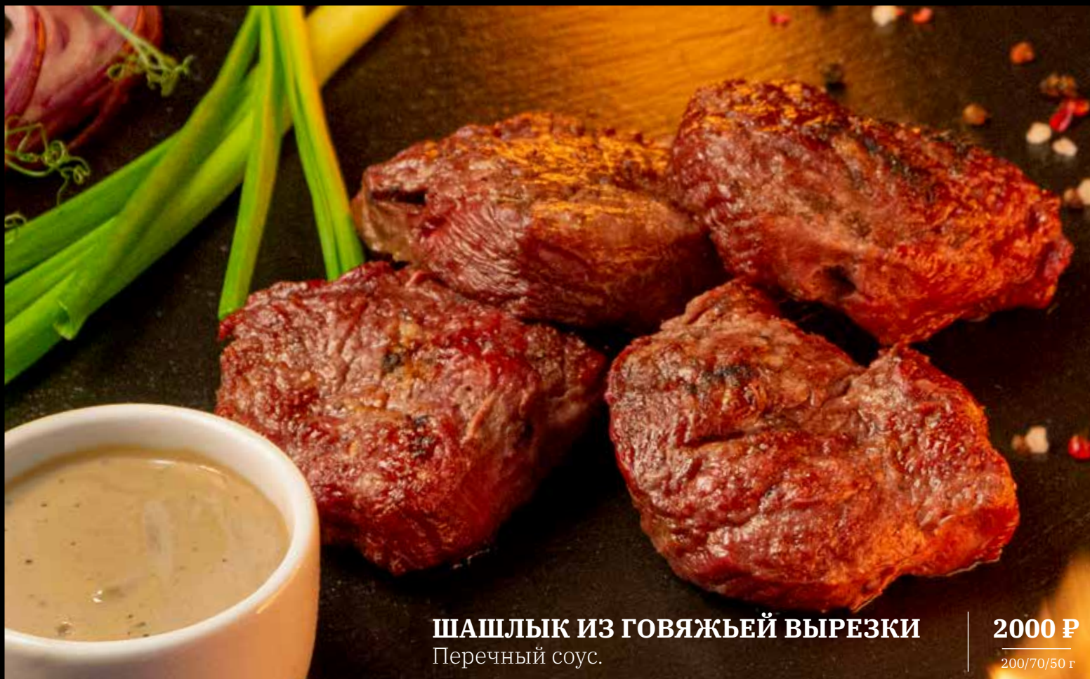
ШАШЛЫК ИЗ ГОВЯЖЕЙ ВЫРЕЗКИ Перечный соус.