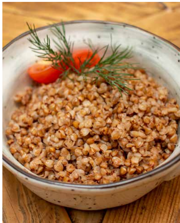
ГРЕЧКА С ЛУКОМ