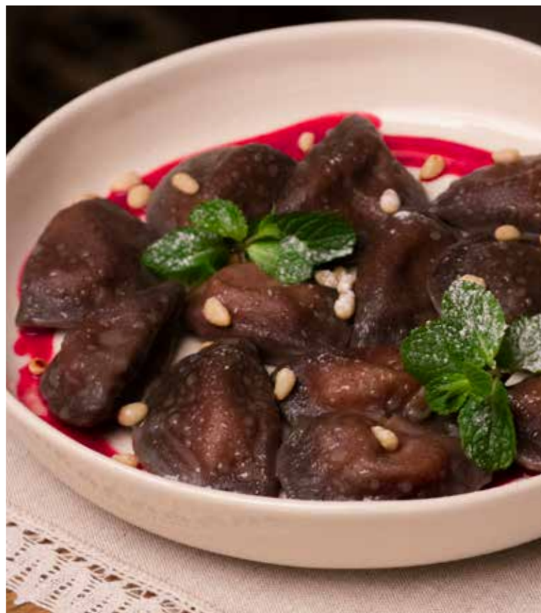
ЧЕРЁМУХОВЫЕ ВАРЕНИКИ С ТВОРОГОМ 200/50/50 г | 550 Р Вареники из пшеничной муки с добавлением ягод черёмухи и начинкой из творога. Густая домашняя сметана, бруснично-малиновый соус.