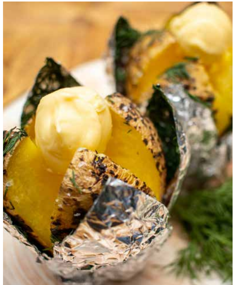
КАРТОФЕЛЬ В МУНДИРЕ