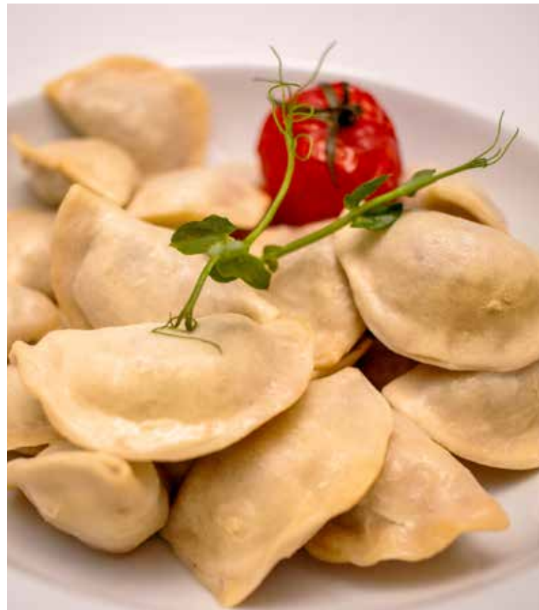
«СТАРОРУССКИЕ» С ПОТРОХАМИ 200/70 г | 550 Р Вареники с начинкой из обжаренных говяжьих потрохов, соус из белых грибов.