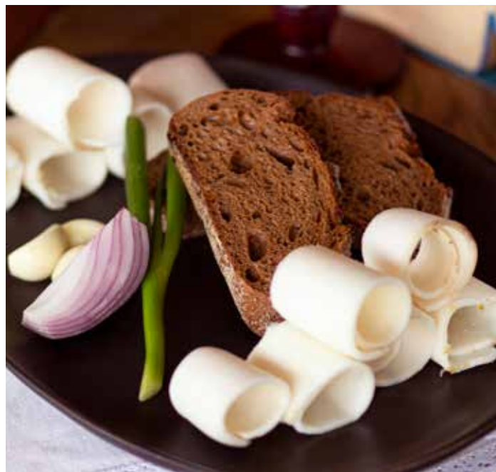
ДЕРЕВЕНСКОЕ СОЛЁНОЕ САЛО

Бородинский хлеб, крымский лук и горчица.