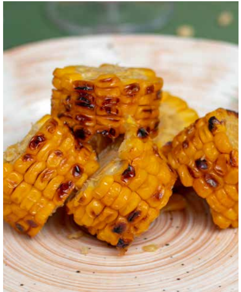
КУКУРУЗА НА МАНГАЛЕ