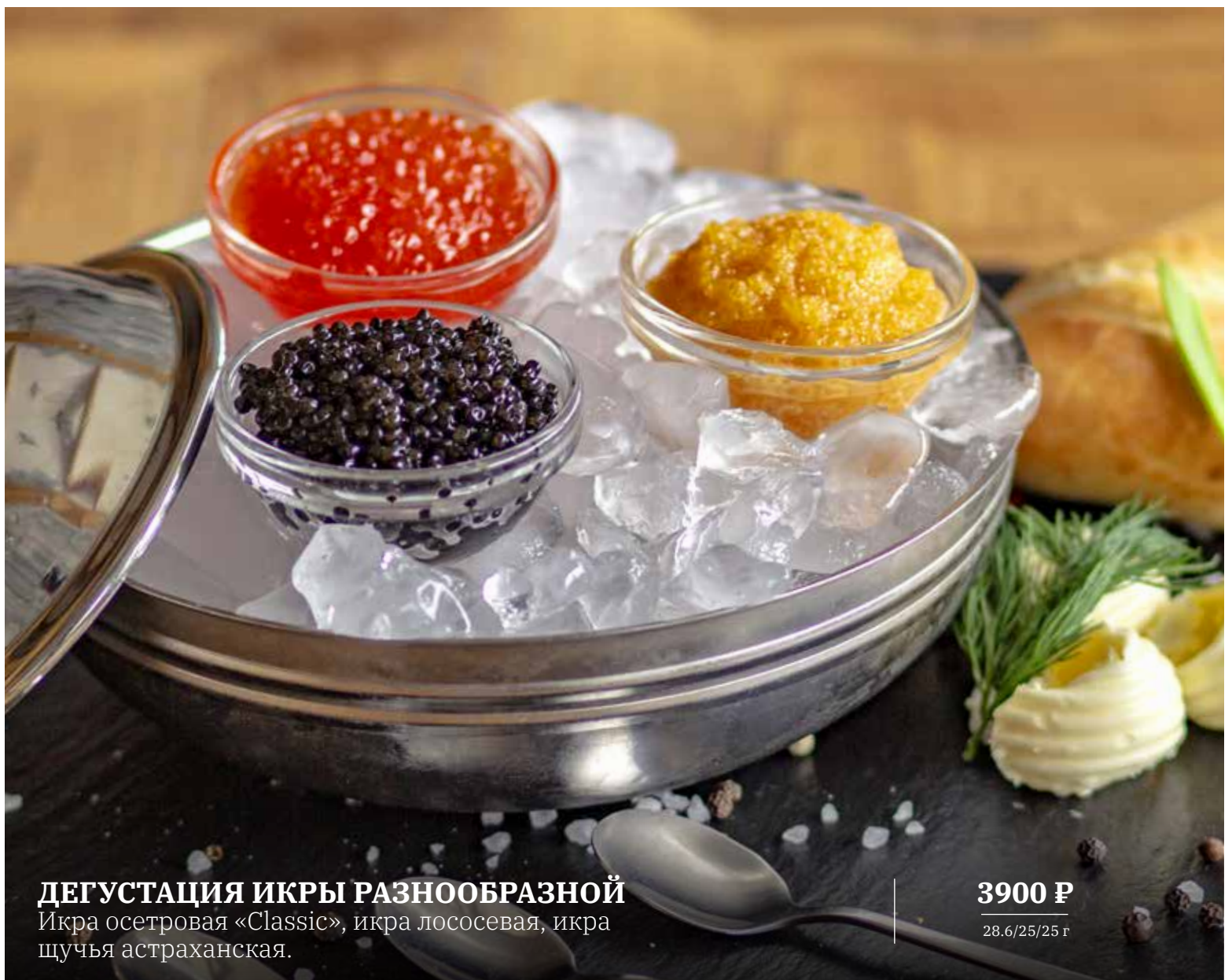
ДЕГУСТАЦИЯ ИКРЫ РАЗНООБРАЗНОЙ Икра осетровая «Classic», икра лососевая, икра щучья астраханская.