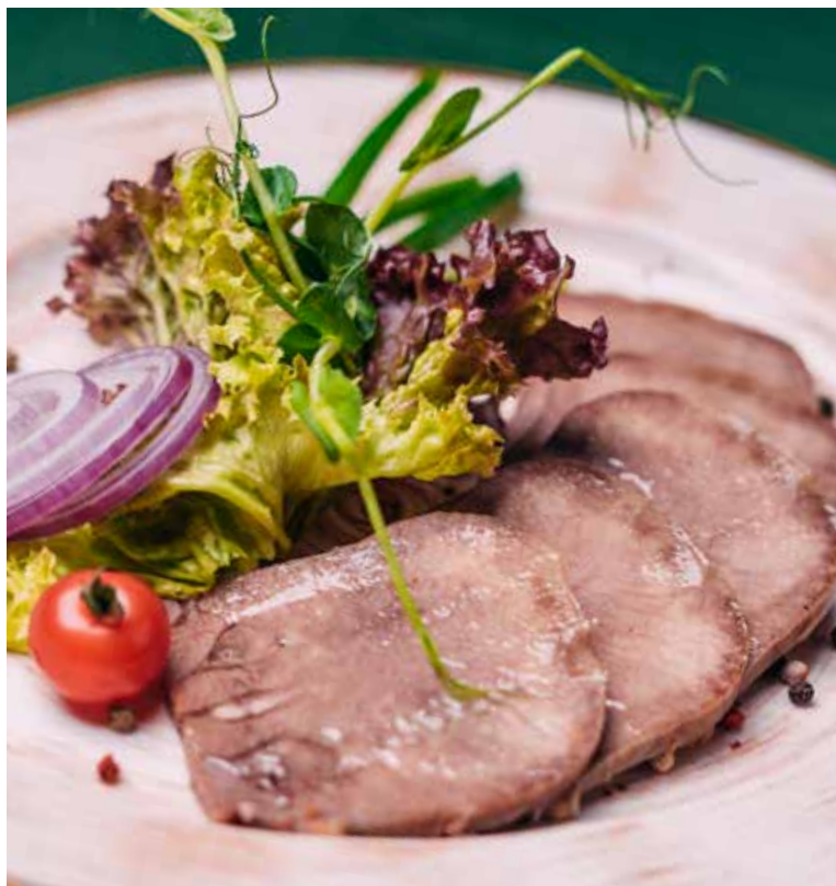
ГОВЯЖИЙ ЯЗЫК С ТЁРТЫМ ХРЕНОМ