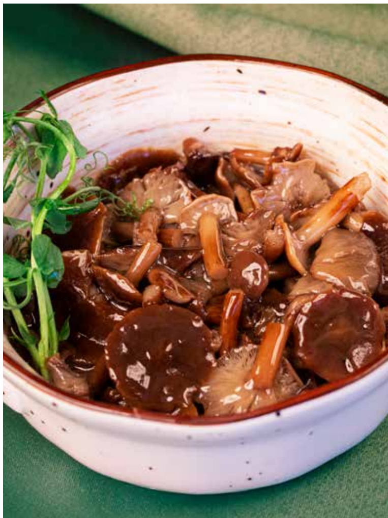
ОПЯТА ПОДМОСКОВНЫЕ МАРИНОВАННЫЕ