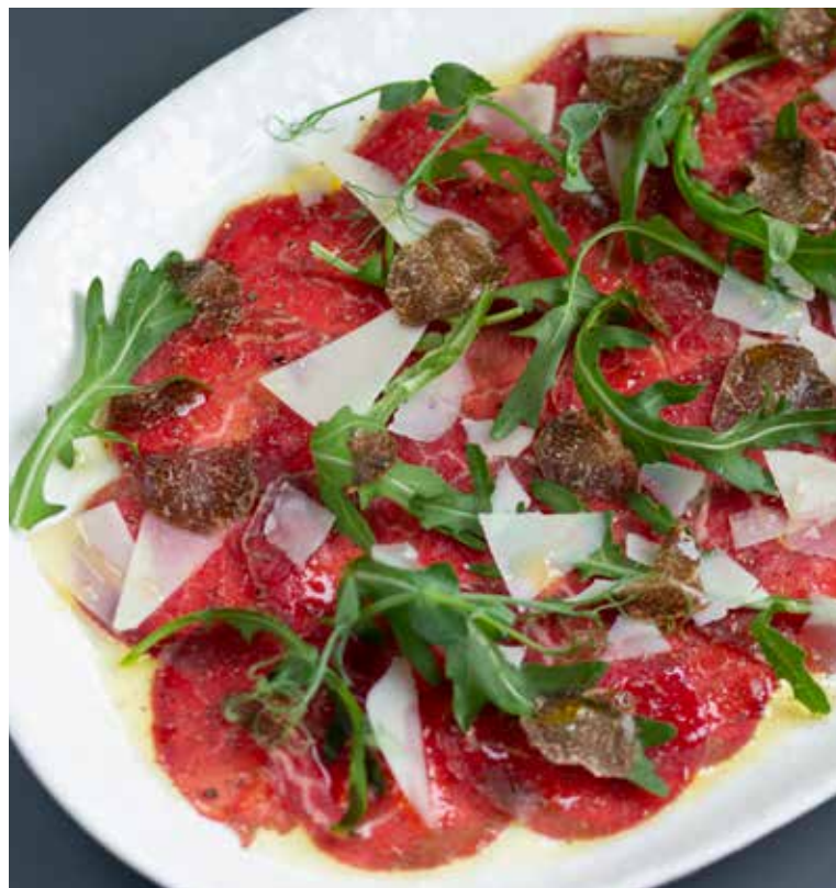
КАРПАЧО ИЗ ГОВЯДИНЫ 95 г | 1350 Р чёрный трюфель, руккола, сыр Грана Подано.