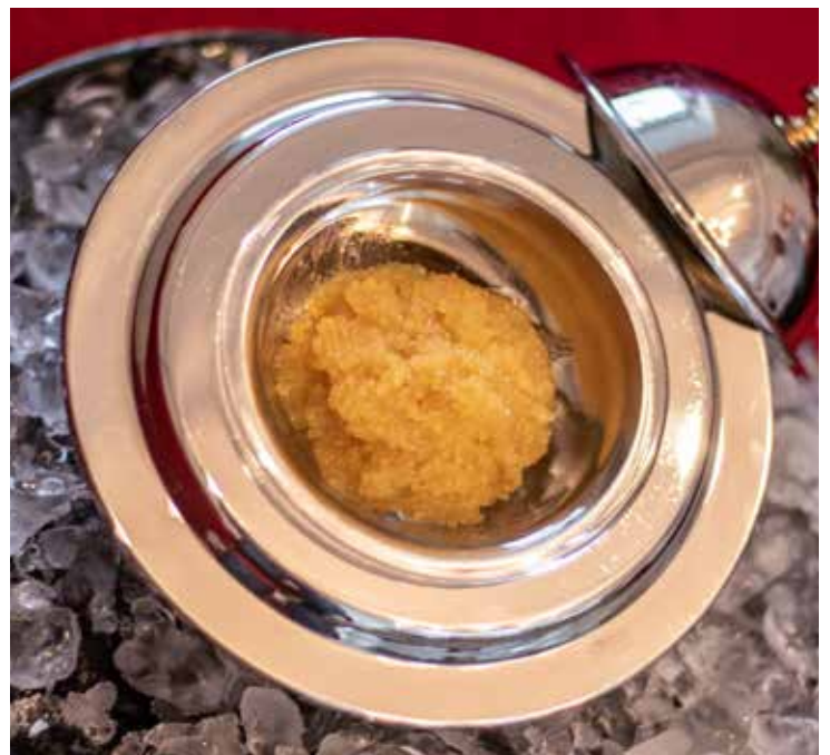
ИКРА ЩУЧЬЯ АСТРАХАНСКАЯ