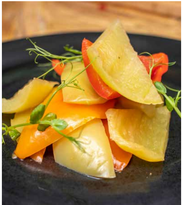
КУБАНСКИЙ ПЕРЕЦ МАРИНОВАННЫЙ