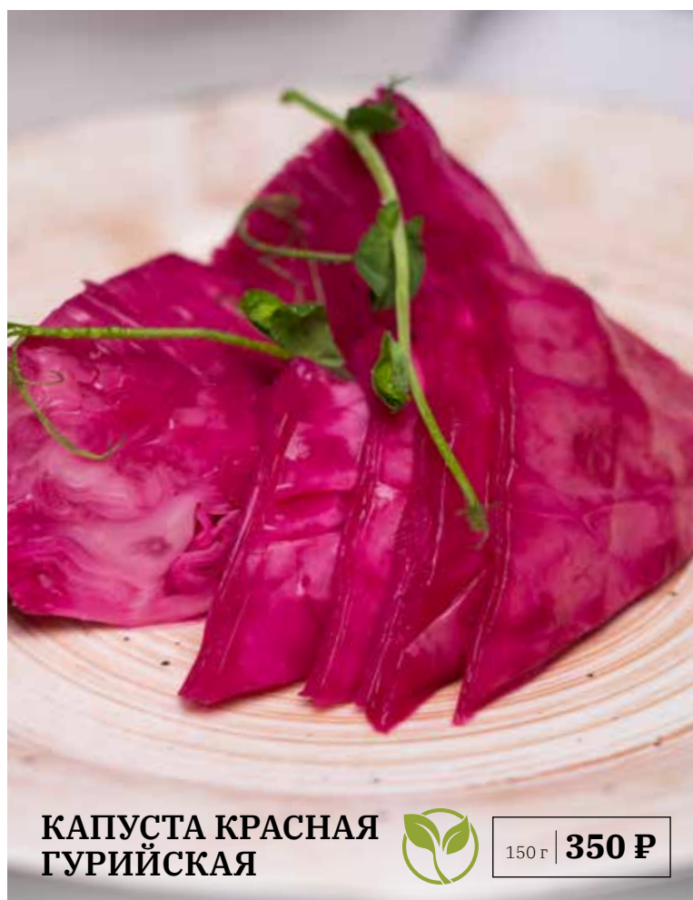
КАПУСТА КРАСНАЯ ГУРИЙСКАЯ