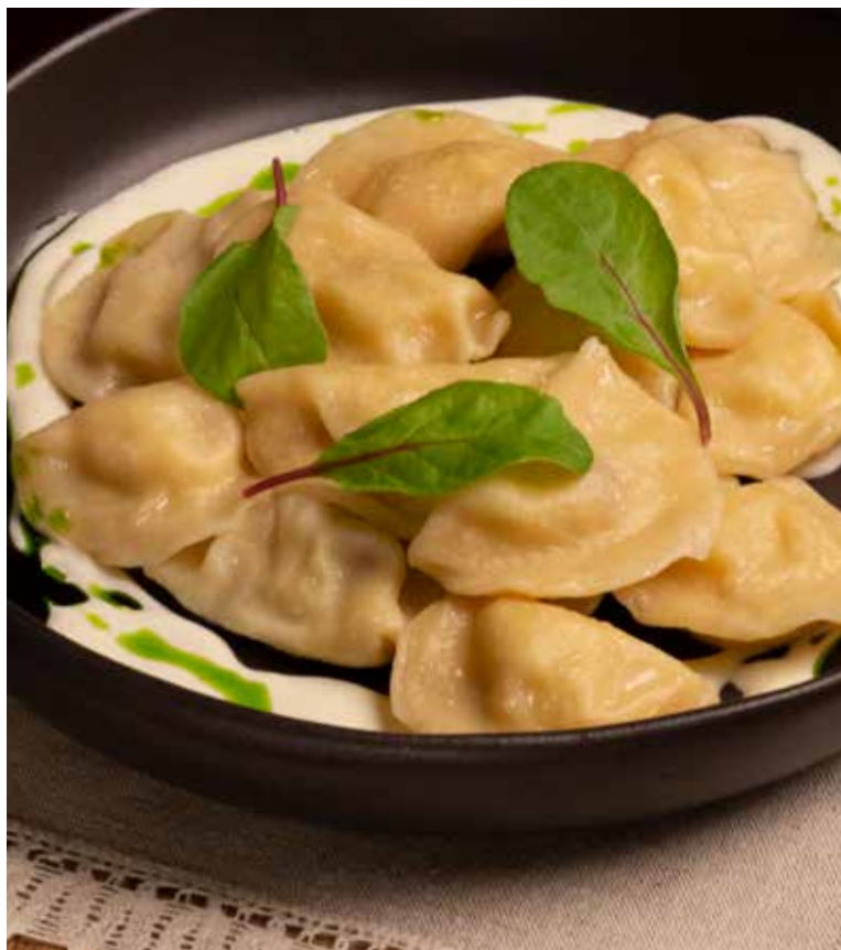
ВАРЕНИКИ С ТВОРОГОМ И ШПИНАТОМ 200/50 г | 550 Р Вареники из пшеничной муки с начинкой из творога и шпината, сливочный соус.