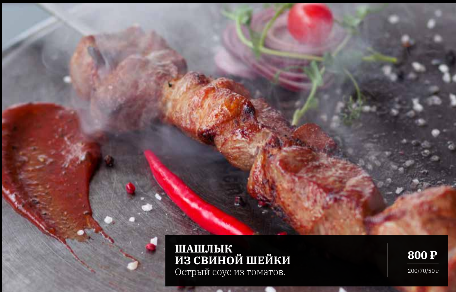
ШАШЛЫК ИЗ СВИНОЙ ШЕЙКИ Острый соус из томатов.