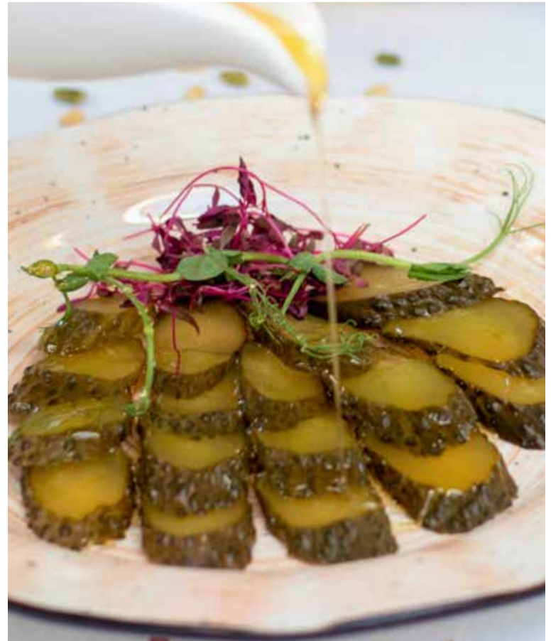
ПЕРЕСЛАВСКИЙ ОГУРЧИК 150/50 г | 350 Р

Древнерусская закуска, корнями уходящая в далёкое прошлое. Тонко нарезанный солёный огурец, политый янтарным цветочным мёдом.